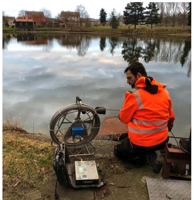
Obr. 1 a 2: Kamerové zkoušky velkého rybníku