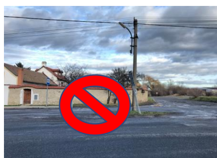
Obr. č. 2 – Místo, kde by se nemělo parkovat