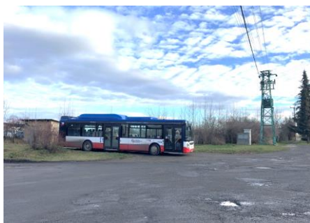
Obr. č. 1 – Nové místo pro parkování autobusů